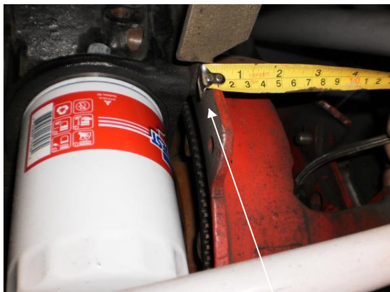
Joint moteur-transmission: Position 0"